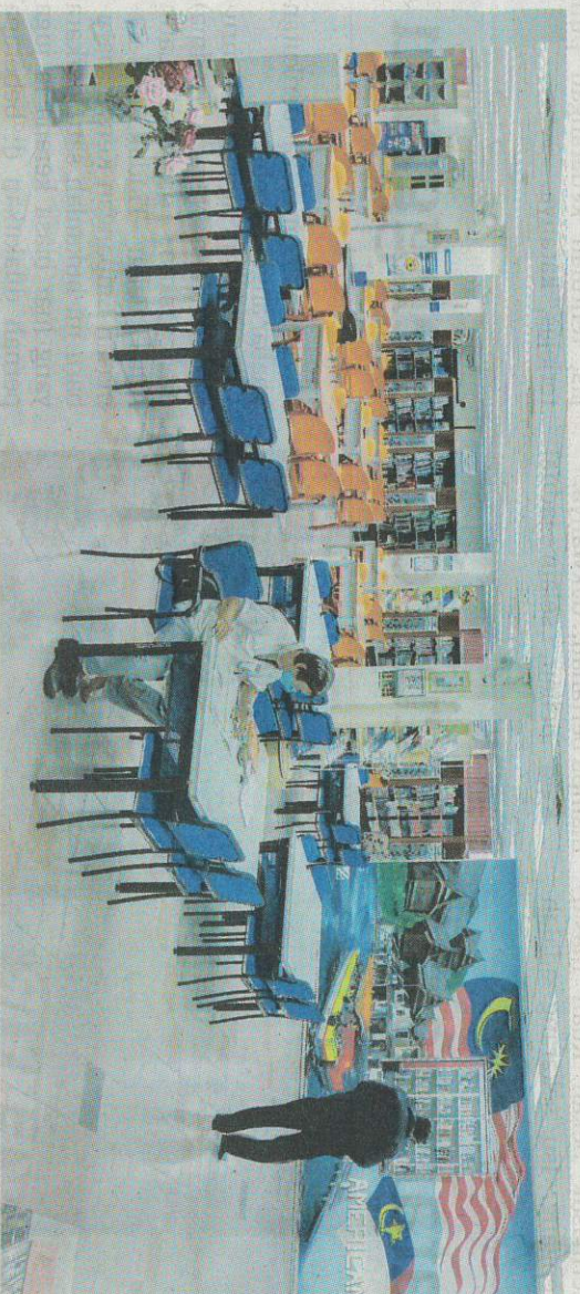
SUSANA perpustakaan negeri di Bukit Baru, Melaka yang langgang pada waktu pagi berbanding waktu tengah hari dan petang, susulan ramai pelajar sekolah yang datang untuk mengulang kaji.

Di Alor Setar, KEDAH, inisiatif diambil Perbadanan Perpustakaan Awam Kedah (PPAK) yang memperkenalkan program myLibrarian secara pandu lalu memudahkan pelanggan bagi perkhidmatan